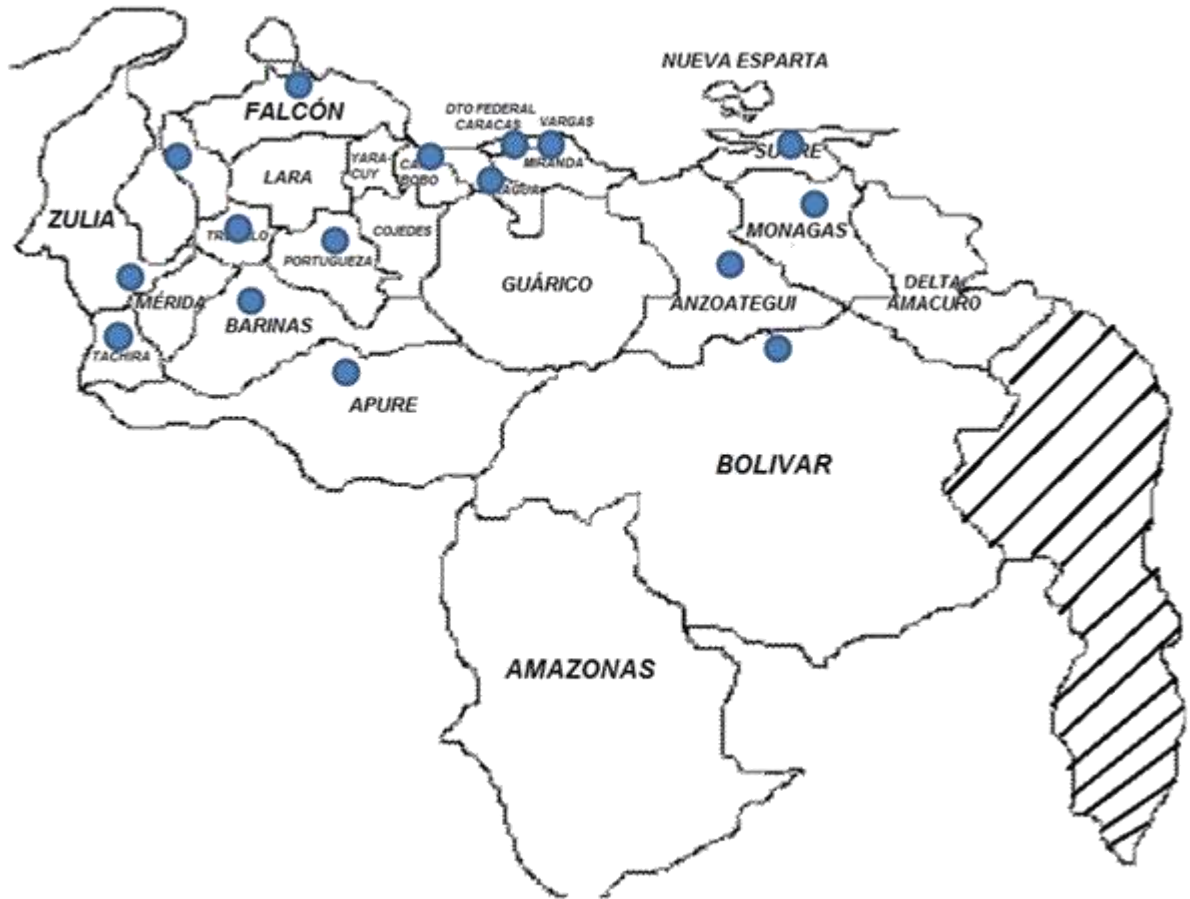
Fig. 1 Mapa de Venezuela. Ubicación geográfica del PNF en Mecánica

En la imagen se muestra la ubicación de las instituciones que gestionan el PNF en Mecánica en el país.