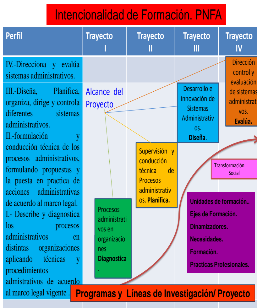
Figura N° 3: Intencionalidad de Formación del PNFA